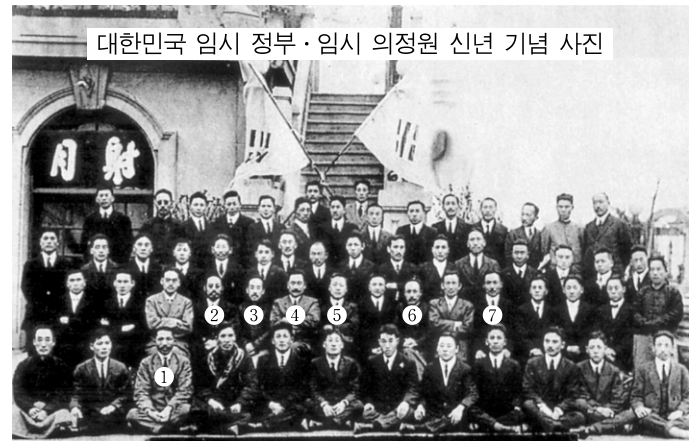
① 김구 ② 신규식 ③ 이시영 ④ 이동휘 ⑤ 이승만 ⑥ 이동녕 ⑦ 안창호

19. 다음 사진을 촬영했을 당시의 대한민국 임시 정부에 대한 설명으로 옳은 것만을 <보기>에서 있는 대로 고른 것은? [3점]