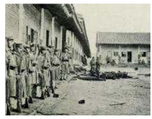
<무기를 접수한 일본 군대>

지난 밤 비용 절약을 위해 군제를 개혁하여 황궁 시위병만 남기고 모두 해산한다는 조치가 발표되었다. 이는 마치 황제의 의지인 듯 보이지만 사실은 이완용과 이토 히로부미의 농간에 의한 것으로, 이로 인해 국가 방위를 위한 최소한의 상징성도 사라지게 되었다.