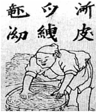
<쯔놈 문자로 쓰여진 책>

쯔놈 문자는 쥘 왕조가 한자와 유교 등 중국 문물을 적극 수용하여 발전하는 가운데 문화의 자주성을 높이기 위하여 만든 것이다. 쥘 왕조 이래로, 쥔놈 문자는 이 문자로 쓰여진 시가 국어시(國語詩)라고 불릴 만큼 널리 쓰이다가, 20세기에 들어와 로마자 표기법이 보편화되면서 더 이상 사용되지 않게 되었다.