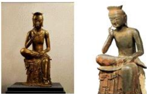
금동 미륵보살 반가상 목조 미륵보살 반가상