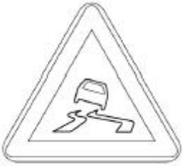
② 미끄러운 도로 표지