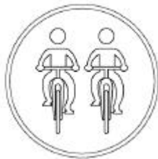
④ 자전거 주차장 표지

12. 「도로교통법 시행규칙」상 편도 1차로 고속도로에서의 최고 속도는?