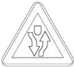
③ 양측방향 통행 표지