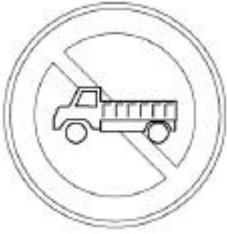
① 승합자동차 통행금지 표지