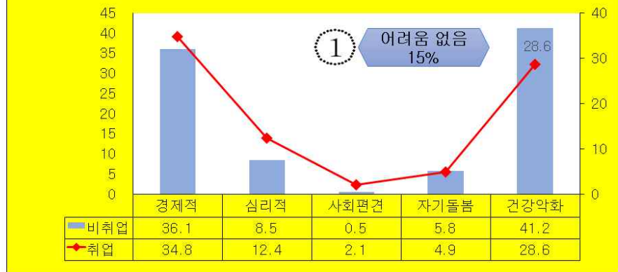
취업여부별 예상되는 어려움(단위:%)